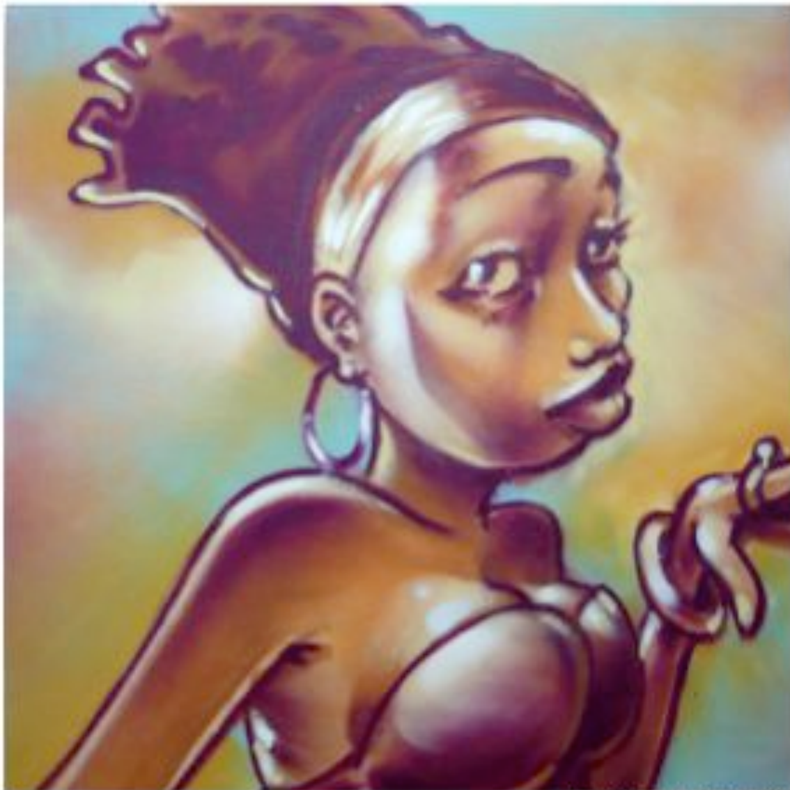
«A beautiful day», aérosol sur toile, 2010.