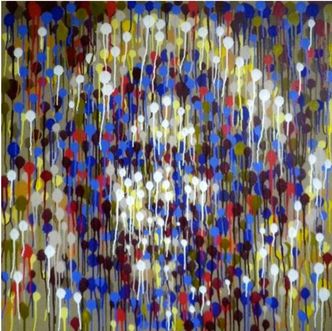
Yann LAZOO, « Drippin' Ibrahim Fall », 100x100 cm, aérosol sur toile, 2013