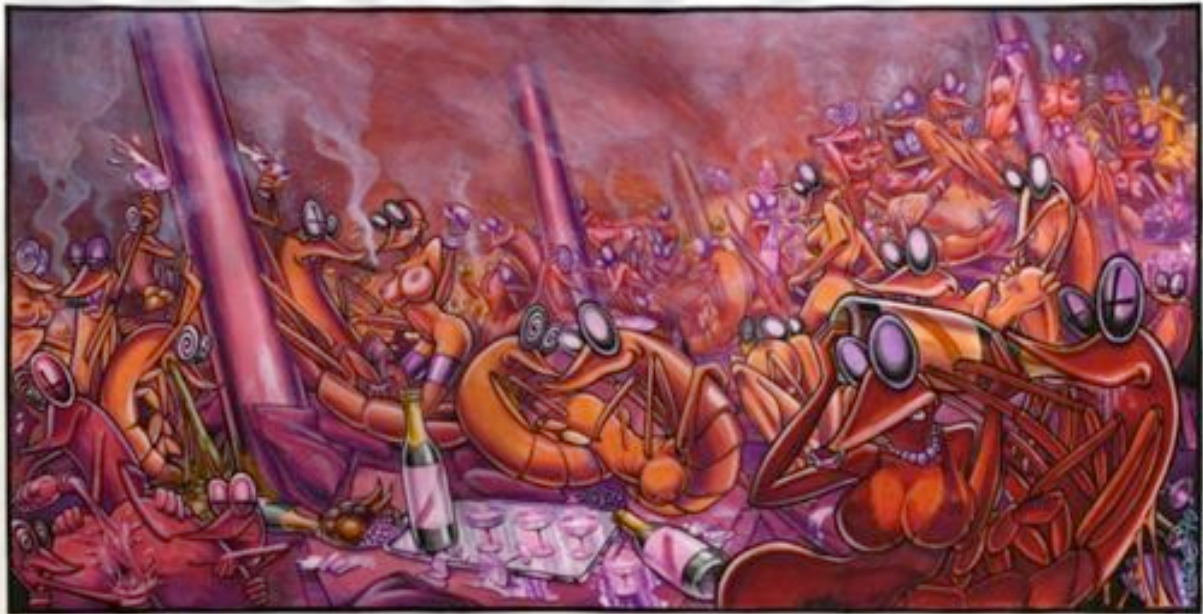
Yann Lazoo, « Prawns », 2014, 75x150 cm, pochette de l'album « Prawns » du groupe The Big Cheese All Stars,

Tirage sur plexi limité à 10 exemplaires