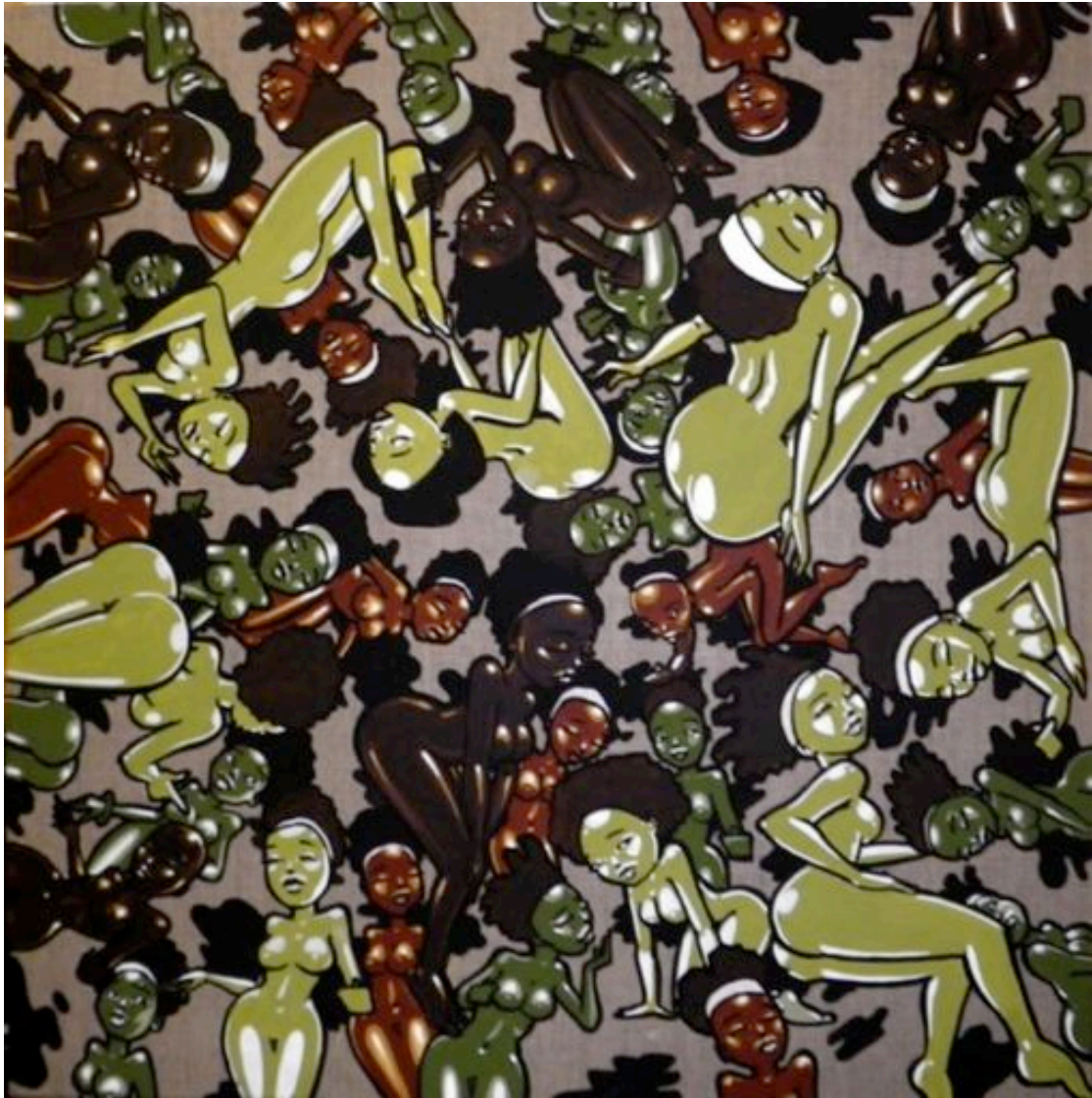
Yann LAZOO, « Camouflage Ladies », 60x60 cm, technique mixte sur toile, 2012