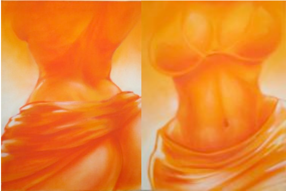
Yann LAZOO, « Recto » « verso », 60x80 cm (x2), aérosol sur toile, 2003