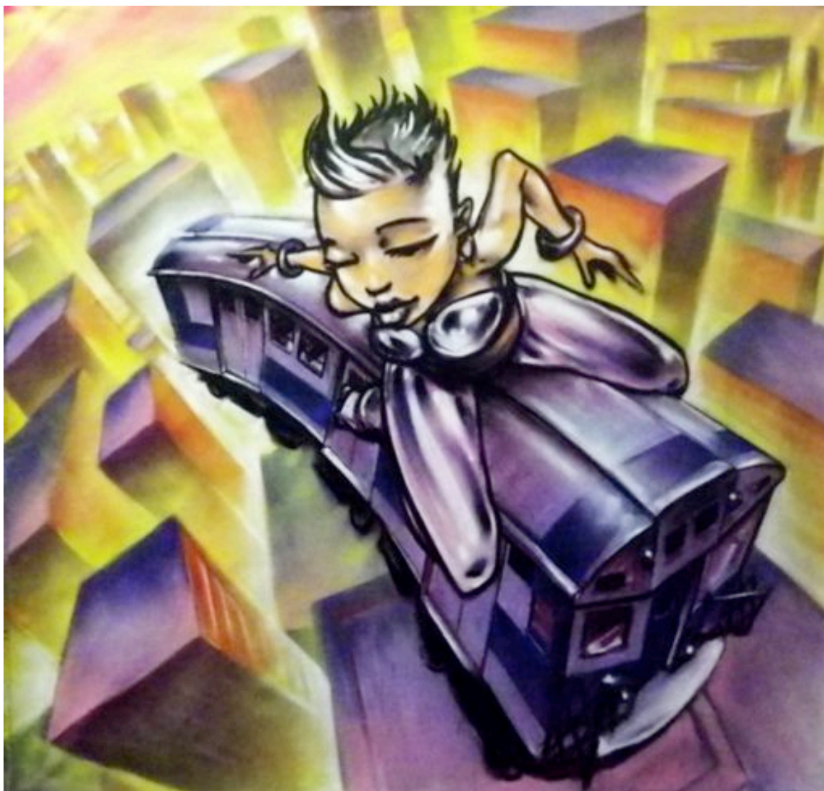
Yann LAZOO, « Flying High », 130x130 cm, aérosol sur toile, 2011