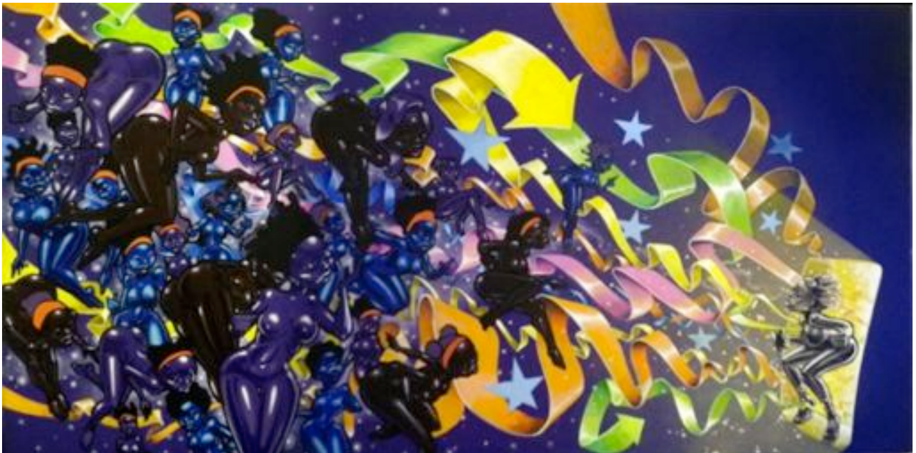
Yann LAZOO, « Deep purple Funk », 40x80 cm, technique mixte sur toile, 2014